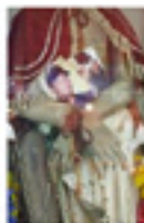
14. Cripta lungo il mercato di Ballarò