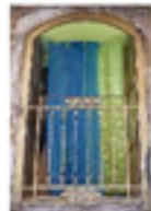
13. Finestra sul mercato di Ballarò