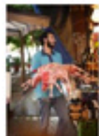
10. Trasporto carni al mercato Ballarò